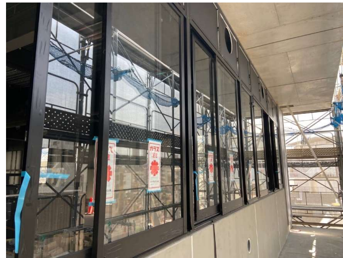
アルミサッシ取付状況