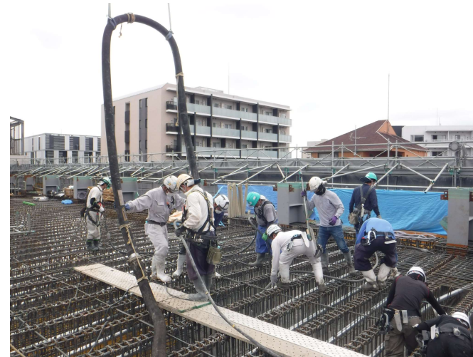
5F床コンクリート打設