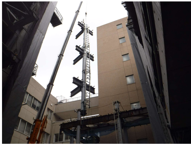
渡り廊下鉄骨建方