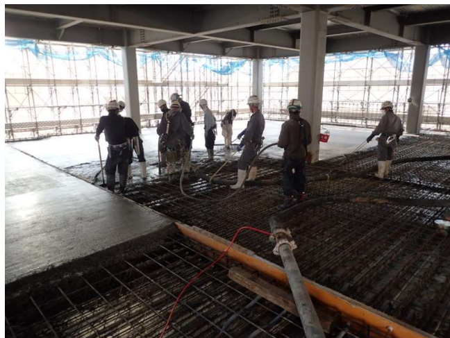
コンクリート打設