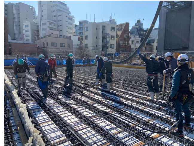
コンクリート打設①