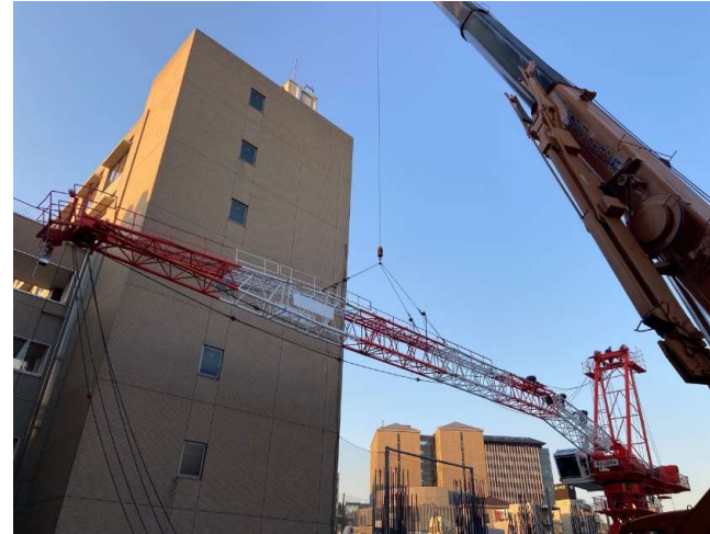
タワークレーン組立②