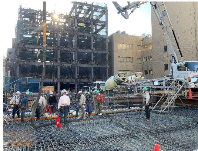
コンクリート打設状況