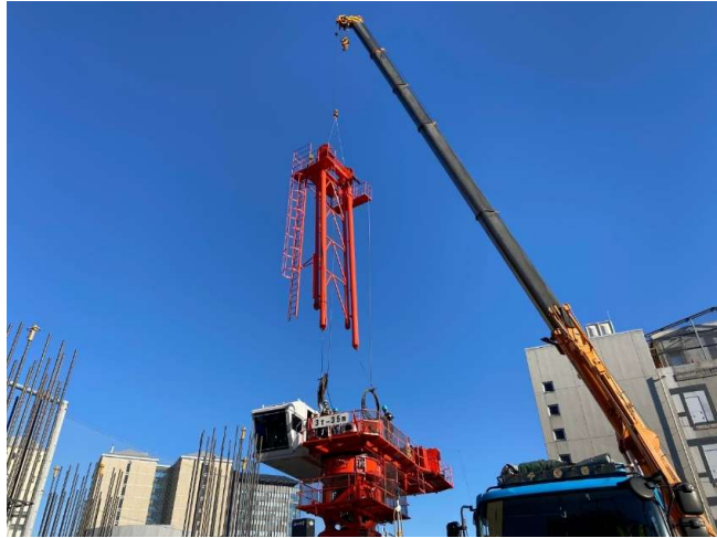
タワークレーン組立①